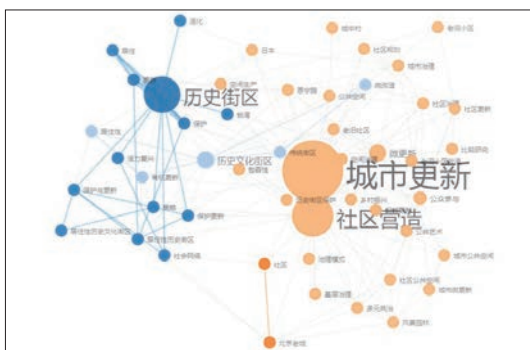
图1 “城市更新与社区营造”主题文献知识图谱 Fig.1 Knowledge map on urban renewal and community building

传统更新普遍停留在物质层面,沦为“贫困美学化”下的翻新,得到发展的是容积率 and