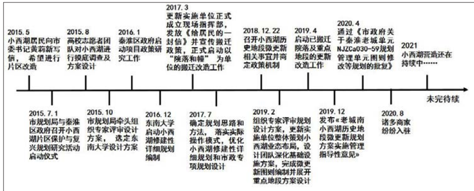
图4 小西湖更新治理进程 Fig.4 Renewal and governance process of Xiaoxihu Project