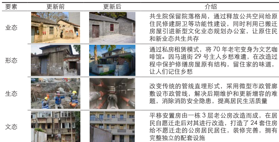
表4 小西湖“存量活化”更新前后对比 Tab.4 Comparisons of Xiaoxihu Project before and after the renewal

社区营造是社会治理能力现代化背景下城市更新治理转型的重要路径。居住性历史街区的生长历程、人文气息及其叠加的家国情怀、发展印记是延续城市魅力的核心价值。正如小西湖项目,用协作共赢的方式延续城市的悠悠文脉,用精细优质的设计语言注入城市空间的重塑。其更新历程表明,我们要用