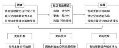
图3 社区营造与居住性历史街区更新治理融合框架 Fig.3 Integration framework of community building and renewal and governance of residential historic districts