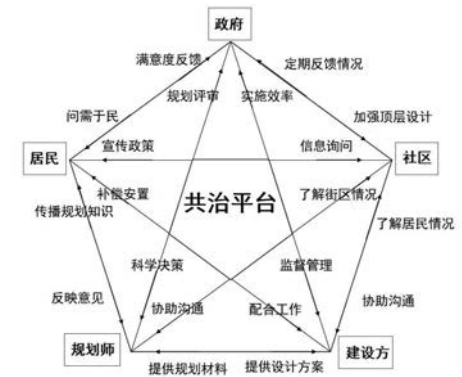
图6 五方协商平台多元主体治理结构 Fig.6 The multi-subject governance structure of the five-party consultation platform