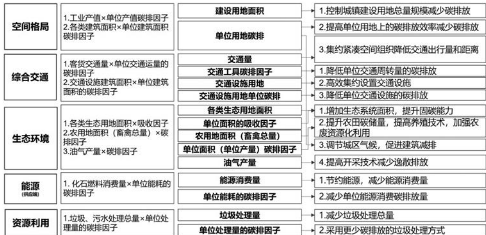
图4 重点领域减碳增汇的主要影响因素和相关导向 Fig.4 Main influencing factors and strategic directions for carbon reduction and sink enhancement in key areas 资料来源:笔者自绘。