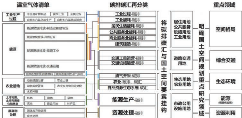
图3 衔接温室气体清单的国土空间规划重点领域 Fig.3 Key areas of territorial spatial planning that connect greenhouse gas inventories

重点领域遵循“规划基础+影响因素+关注重点”到“优化方向”的研究路径。空间格局方面,上海提出构建多中心空间体系、培育新城综合性独立节点城市等举措都体现了低碳的总体导向。通过建设大都市圈、城镇圈和