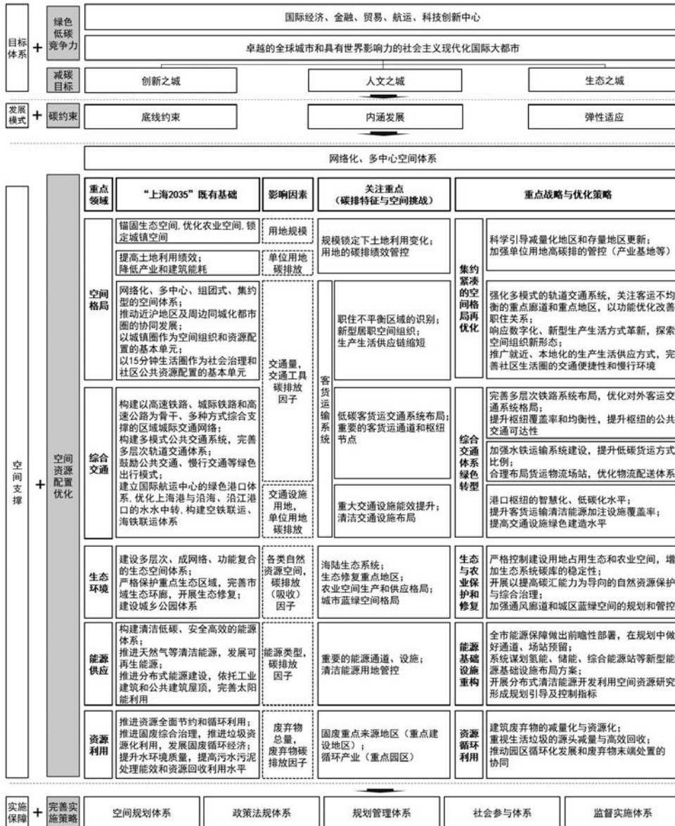
图5 碳约束背景下的国土空间规划响应框架 Fig.5 Response for territorial spatial planning under carbon constraints