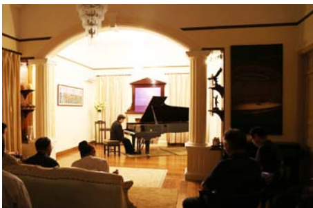
图3 鼓浪屿家庭音乐会