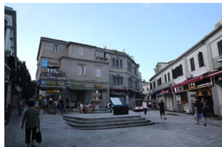
图4 鼓浪屿社区公共空间改善

与旅游的主要商业场所,开展商业业态细化规划引导和景观整治提升,通过高校工作坊的工作模式,形成与商家业者的良好互动和共同参与,整治后的商业街氛围有序,景观协调。对岛上各个类型的宗教建筑及时加以保护性修缮,改善宗教活动场所条件,使宗教建筑成为凝聚社区信众的载体,从而维护社区的稳定。此外,还有计划地对历史风貌建筑活态利用开展专题研究,努力创造业主愿意积极参与其中的氛围,从而实现保护与利用的双赢。