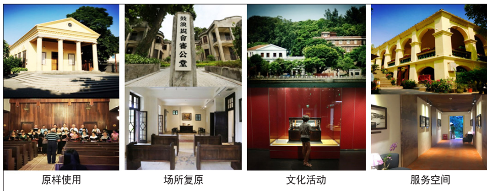
图5 历史建筑活化利用的4种方式

日上岛的游客人数不超过4万。同时,政府有关部门积极推行社区(旅游区)垃圾减量、分类和不落地等文明措施,采用旅行团无声导览方式,规定沿街店家不得高声叫卖,有效地解决了噪音扰民问题,并通过细化餐饮业的经营管理,严格限制可能产生油烟的餐饮业态,极大地改善了社区环境氛围。