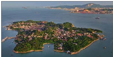
图1 鼓浪屿全貌