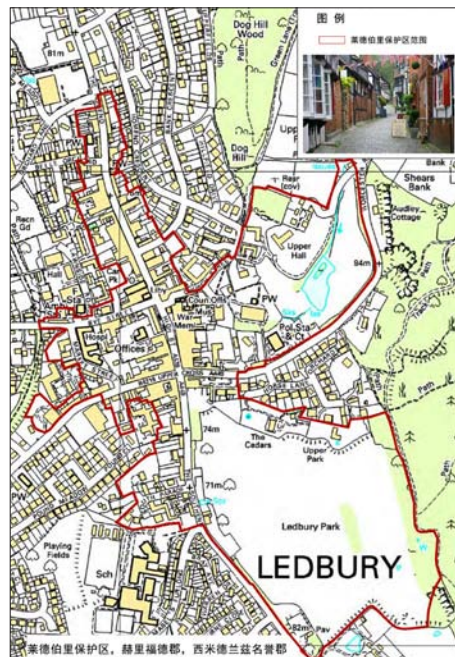
图3 莱德伯里保护区的范围