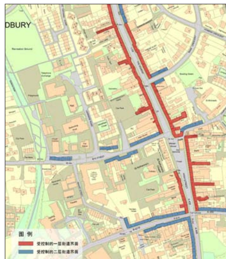
图4 《莱德伯里邻里规划》的历史地区业态控制 资料来源: www.ledburytowncouncil.gov.uk/Ledburys_Neighbourhood_Development_Plan.pdf 。

强制性的要求主要针对历史地区核心商业性道路沿线一层、二层商业业态的控制(见图4)。结合评估分析,莱德伯里在其邻里规划中将商业业态分为5类(A1:零售商业,A2:金融机构,A3:餐饮和咖啡,A4:饮品店,A5:熟食外卖店),提出在范围内受控制的一层街道界面A1、A3和A4功能不能随便调整和取消,并鼓励范围内一层和二层新增3类业态。政策明确未来不得在商业街沿线一层布置A2和A5功能,但是在受控制的二层界面可以增加这