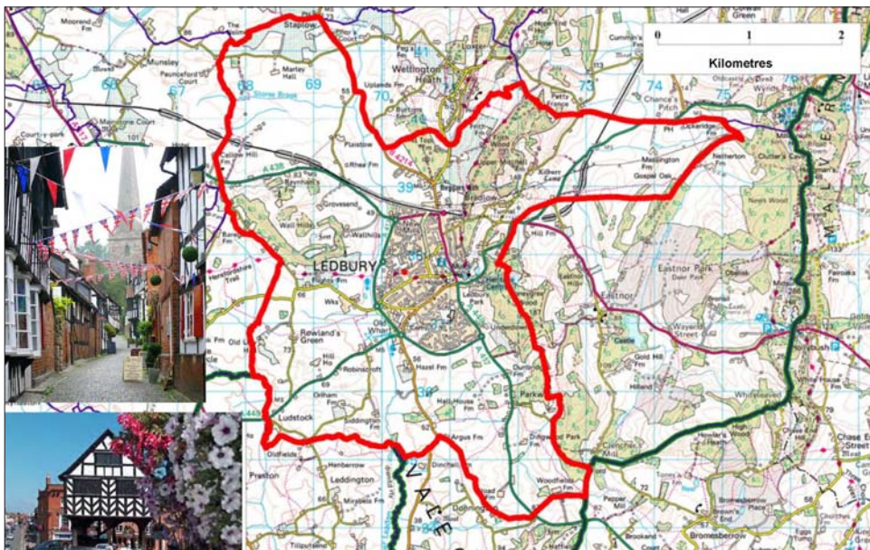
图2 《莱德伯里邻里规划》的规划范围