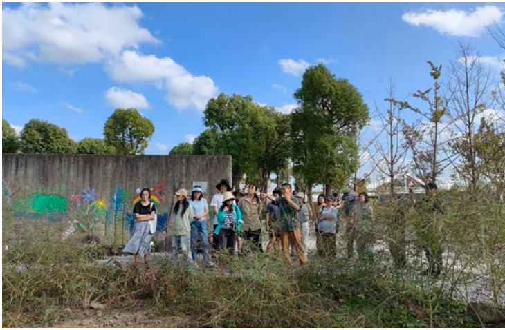
《复园》内开展生境空间营造坊