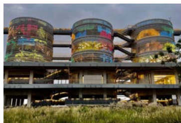
灰仓艺术中心 (杨浦区)