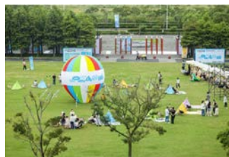
南汇新城展区-春花秋色公园