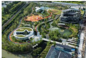
李子园公园 (普陀区)