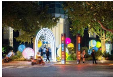
环衡复音乐街区 (徐汇区)