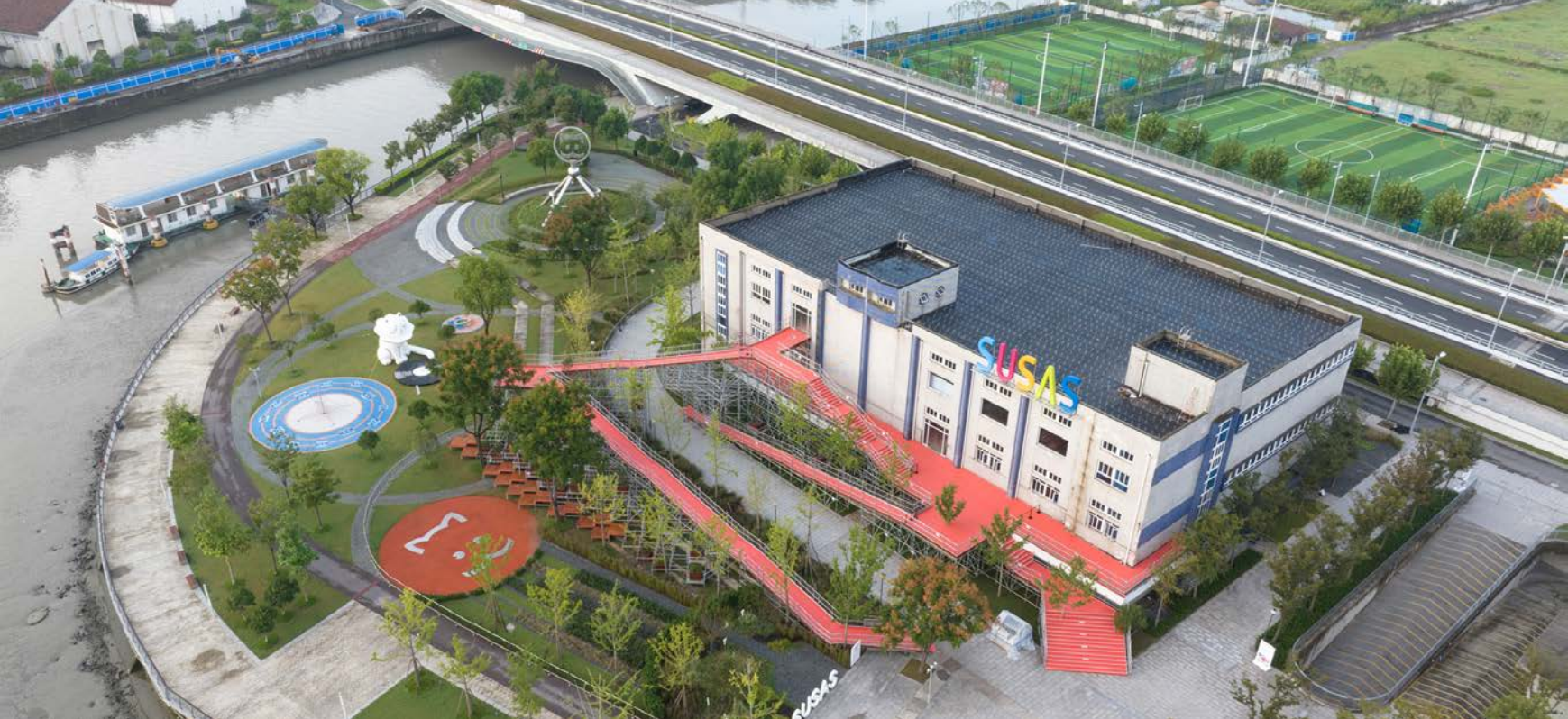
白猫主展馆航拍图