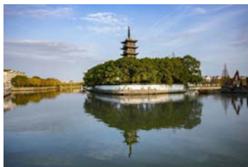
青浦新城展区-青溪园等