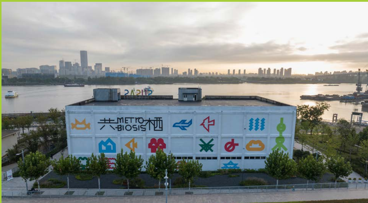
2023上海城市空间艺术季白猫主展馆海报墙

“共生”关系的Metabiosis一词进行了改写,表达了活动立足于都市 (Metropolis) 的观察思考,展现《上海市城市总体规划(2017—2035年)》确定的“生态之城”理念。