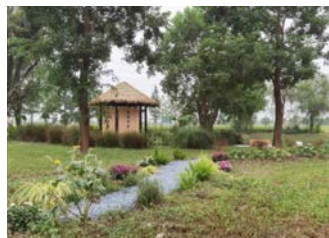
嘉定新城展区-嘉北郊野公园