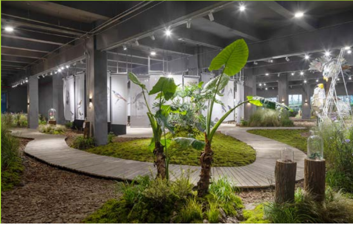
风土水灵·生境空间 大自然保护协会 (TNC)、董全、陈芳