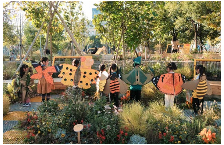
“花园小剧场”艺术工作坊

未来,上海城市空间艺术季将继续以“文化兴市,艺术建城”为理念,打造具有“国际性、公众性、实践性”的城市空间艺术品牌活动,继承发扬“城市,让生活更美好”的世博精神,通过空间艺术布展与城市有机更新实践的相互推动,赋予城市空间更多的内涵和价值。让短期活动发挥更大的社会价值,让永续发展的理念渗透进城市规划和建设的方方面面。