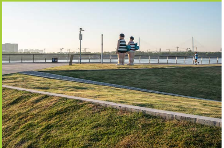
《沐浴者》克莱达特&佩蒂皮耶

“白猫”一楼空间内的展览被命名为“风水土灵·生境空间”：空间内包含室内本地植物群落花园、沉浸式“生态客厅”以及数个与绿植融为一体的科普展览和艺术装置。二、三楼的作品在“共栖”主题之下，分为4个板块依次展开：从“与谁同栖”的关注，到“置身事内”的思考，再到“都市之策”的展望，最后到“自然答案”的期许。