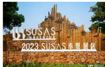
奉贤新城展区-庄行郊野公园