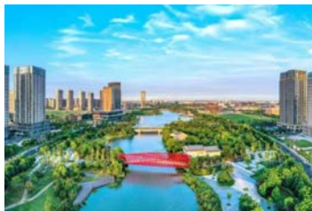
松江新城展区-五龙湖休闲公园