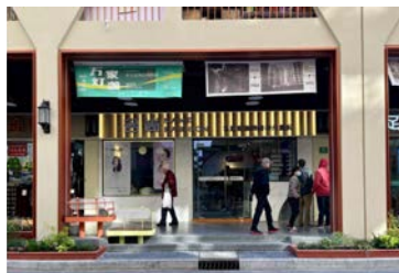
西凌家宅路 (黄浦区)