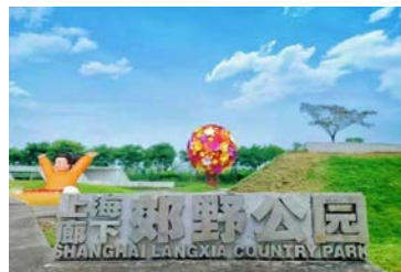
廊下郊野公园 (金山区)