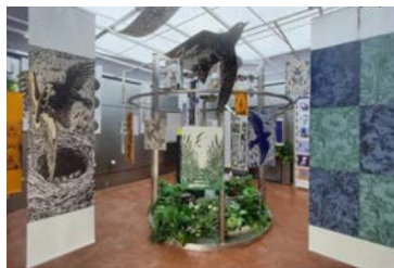
叶榭镇井凌桥村 (松江区)