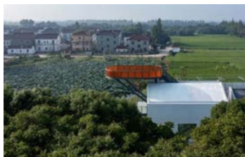
长三角示范展区-双祥村展区