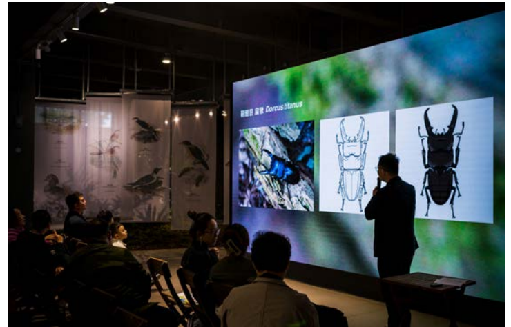
科普论坛《打开自然百宝箱》

未来,上海城市空间艺术季将继续以“文化兴市,艺术建城”为理念,打造具有“国际性、公众性、实践性”的城市空间艺术品牌活动,继承发扬“城市,让生活更美好”的世博精神,通过空间艺术布展与城市有机更新实践的相互推动,赋予城市空间更多的内涵和价值。让短期活动发挥更大的社会价值,让永续发展的理念渗透进城市规划和建设的方方面面。