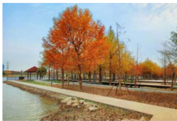
沔青公园 (浦东新区)