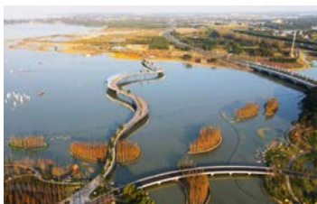
长三角示范展区-元荡展区