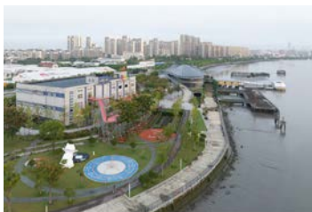
主题演绎展区-徐汇滨江南段