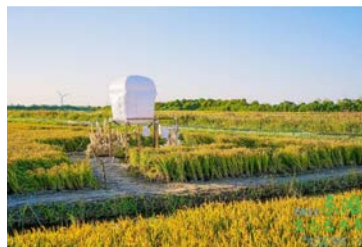
陈家镇东滩地区 (崇明区)