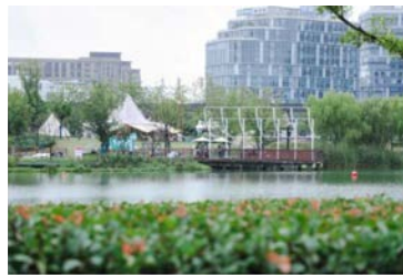
森兰绿地 (浦东新区)