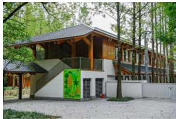
外环生态绿道 (长宁区)