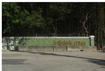
共青森林公园 (杨浦区)