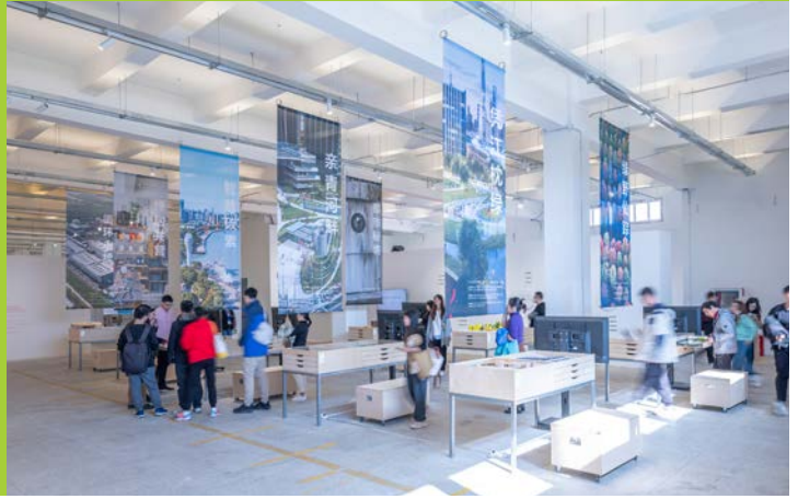
“都市之策”板块,《生态上海》上海市城市规划设计研究院