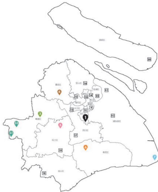
2023空间艺术季上海总图

本届主题“共栖”，意在表达“生态”“环境”等耳熟能详的概念从诞生、发展到现今丰富的整体观和多元性，以“人与自然和谐共生”的价值观为基础，探讨自然与生命如何共栖。“共栖”的英文名称METro-BIOSIS将生物界表达有机“共栖”、物种