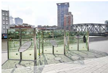
苏河湾公共绿地 (静安区)