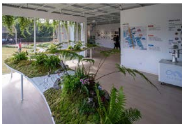
马桥AI创新实验区 (闵行区)