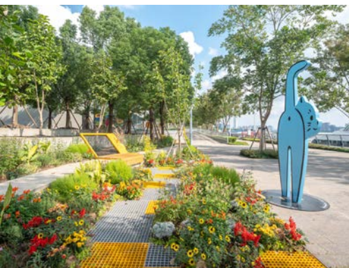
《卧床花园》卅吞设计《猫知道方向》TANGO