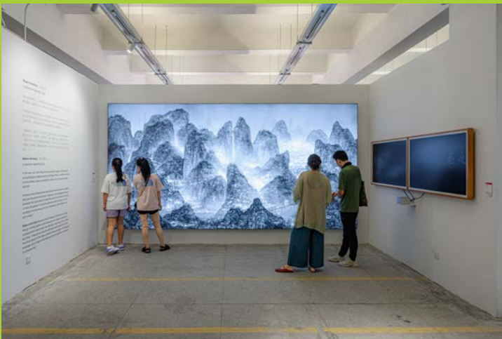
“置身事内”板块,《夜游记》杨泳梁